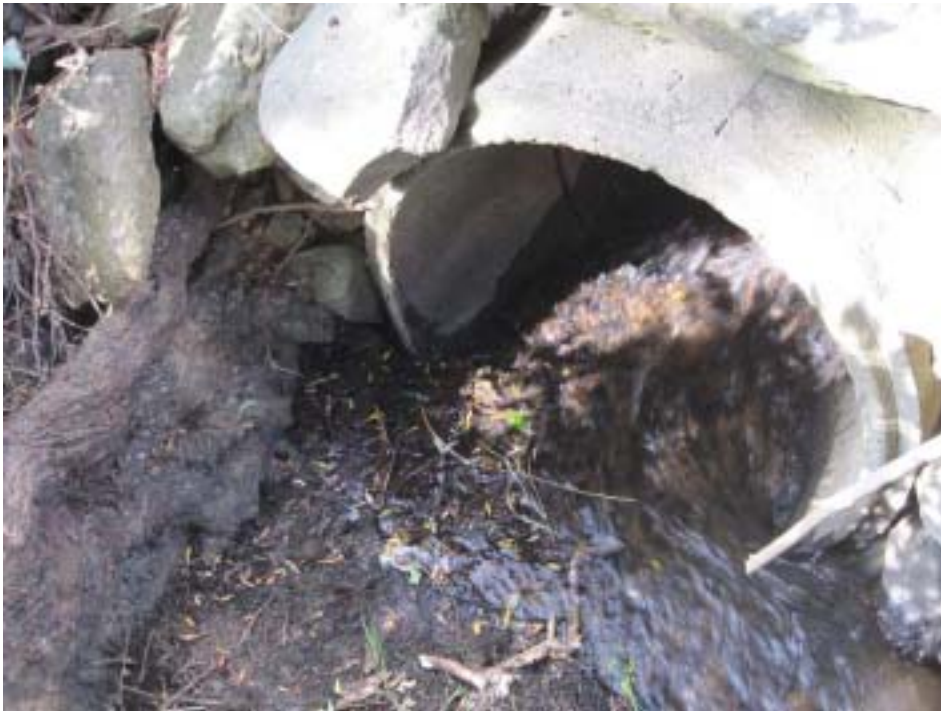
Figur 6. Inloppet i kulverten med ca 0,2 m tjockt av trädrötter i botten. Vattenhastigheten är mycket hög även vid lågt flöde.

Kulverten grävdes upp och lades om med litet fall. Nedströms byggdes en låg tröskel av sten och grus som dämmer så att det även vid lågflöde finns ca 0,15 m djupt vatten i kulverten. Uppströms bron togs pilarna bort och botten stenkläddes. En mindre vilobassäng anlades vid sidan om flödesrännan alldeles uppströms kulverten. Slänterna erosionsskyddades med sten. Efter åtgärd bedöms hindret passerbart för alla arter vid alla flödessituationer.