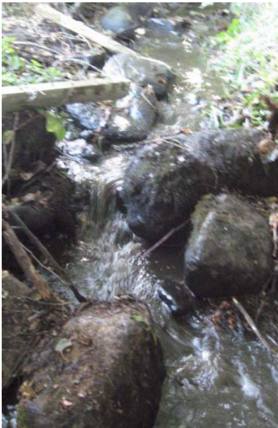
Figur 5. Efter åtgärd är hindret lätt att passera för öring. Svagsimmande arter kan ha svårt i stalpet under låga flöden, men bör kunna ta sig förbi vid måttliga flöden.