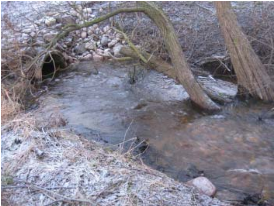
Figur 10. Nedströms kulverten vid högflöde. En djuphåla mellan tröskeln och kulverten ger fisken möjlighet att vila innan passagen