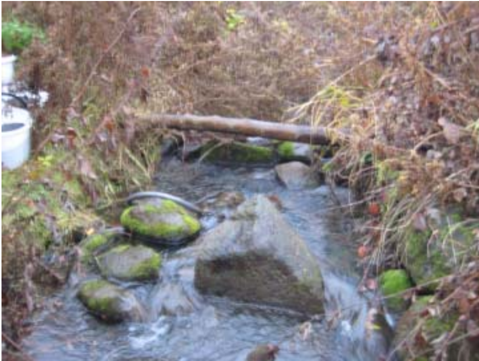
Figur 11. Hindret före åtgärd. Svårpasserat vid låga flöden då vattnet mest rinner mellan stenarna

Stenar i trösklarna flyttades så att bägge trösklar fick ett lägre parti som fisken kan passera genom. Håligheter i trösklar och kanternas stensättning tätades med makadam så att flödet koncentreras till trösklarnas lågpunkt. Efter åtgärd är hindret passerbart för alla arter vid alla flöden.