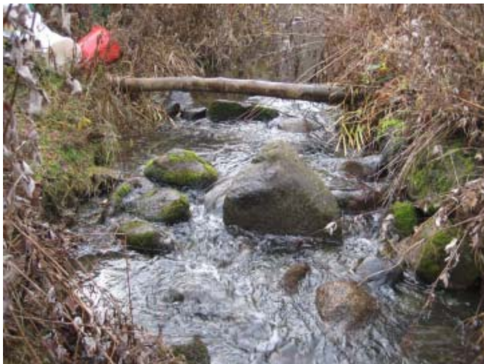
Figur 12. Efter åtgärd finns öppningar i trösklarna där flödet rinner ovanpå stenarna så att fisken kan simma förbi