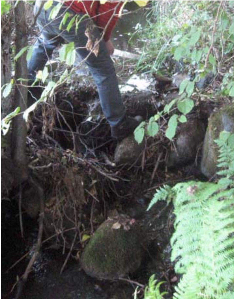
Figur 4. Hindret före åtgärd. Svårpasserat för all fisk, endast stor öring kan ha tagit sig förbi, och detta endast vid ganska höga flöden.