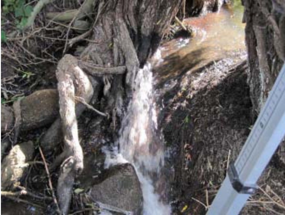
Figur 7. Alldeles uppströms kulverten stod några pilar och dämde så att passagen för fisken försvårades ytterligare.