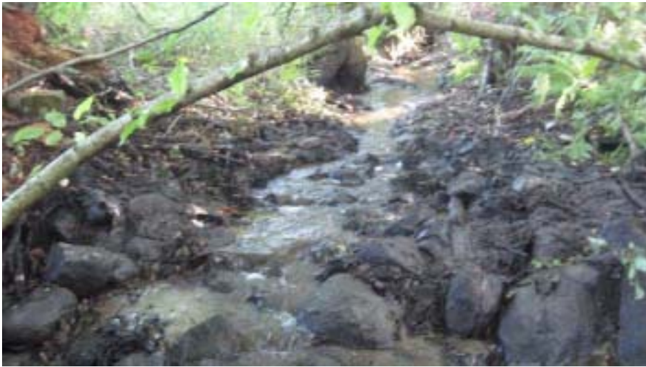
Figur 2. Vandringshinder 13a efter åtgärd.