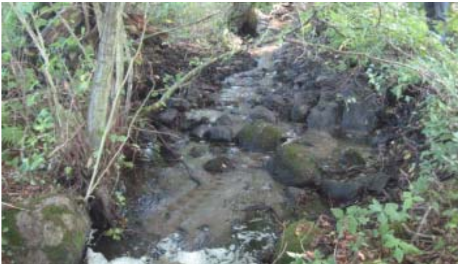
Figur 3. Vandringshinder 13a - nedre delen. Det har tillfälligt ansamlats en hel del sand nedströms. Sanden låg tidigare i och strax uppströms dämnet, och efter höglöde kommer troligen stenbotten att spolans ren igen. Fallet är måttligt och loppet slingrande med måttlig vattenhastighet.