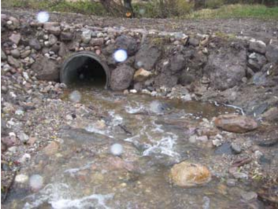
Figur 9. Uppströms bron där träden tidigare skapade ett fall ner mot kulverten. Nu är det måttligt fall i bäcken ner mot kulverten och en ojämn botten av sten vilket medför att fisken lätt kan passera.