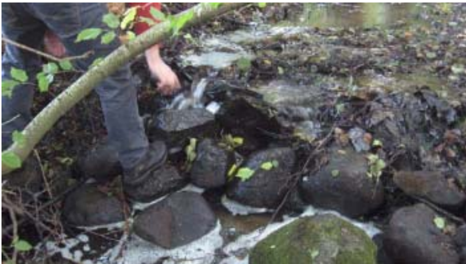
Figur 1. Vandringshinder 13a, Eksholm övre före åtgärden. Ett svårt hinder som öring kan passera endast vid ganska högt flöde

Stentröskeln sänktes av på mitten, och plast som använts som tätning skars bort. Efter åtgärd rinner vattnet koncentrerat i en ca 0,3 m bred fåra vid lågflöde. Fåran har ett måttligt fall, och stenar i botten ger ett lätt slingrande turbulent flöde med måttlig vattenhastighet. Efter åtgärd bedöms hindret vara passerbart för alla arter vid alla flöden.