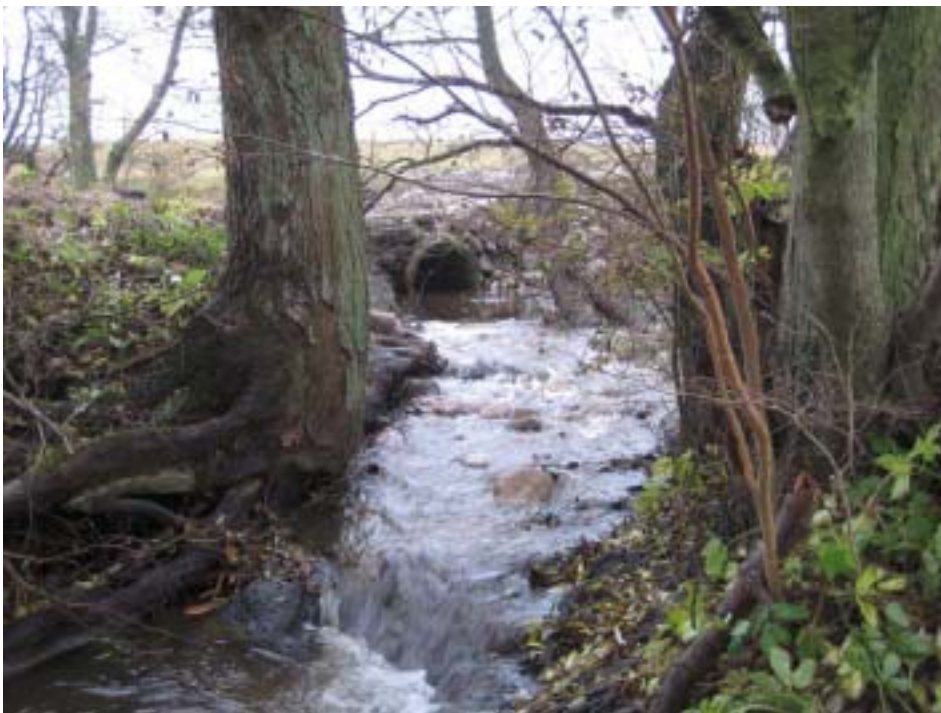
Figur 8. Nedströms bron efter åtgärd. Även vid lågflöde finns det ca 0,2 m vatten i kulverten så fisken kan simma genom den. Fallet nedströms är måttligt